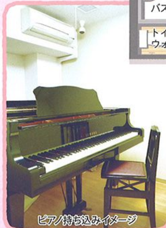
ピアノ持ち込みイメージ