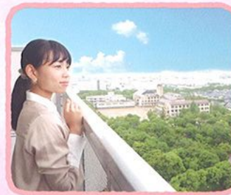
19階北向きのお部屋からの景色。