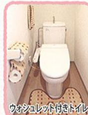
ウォシュレット付きトイレ